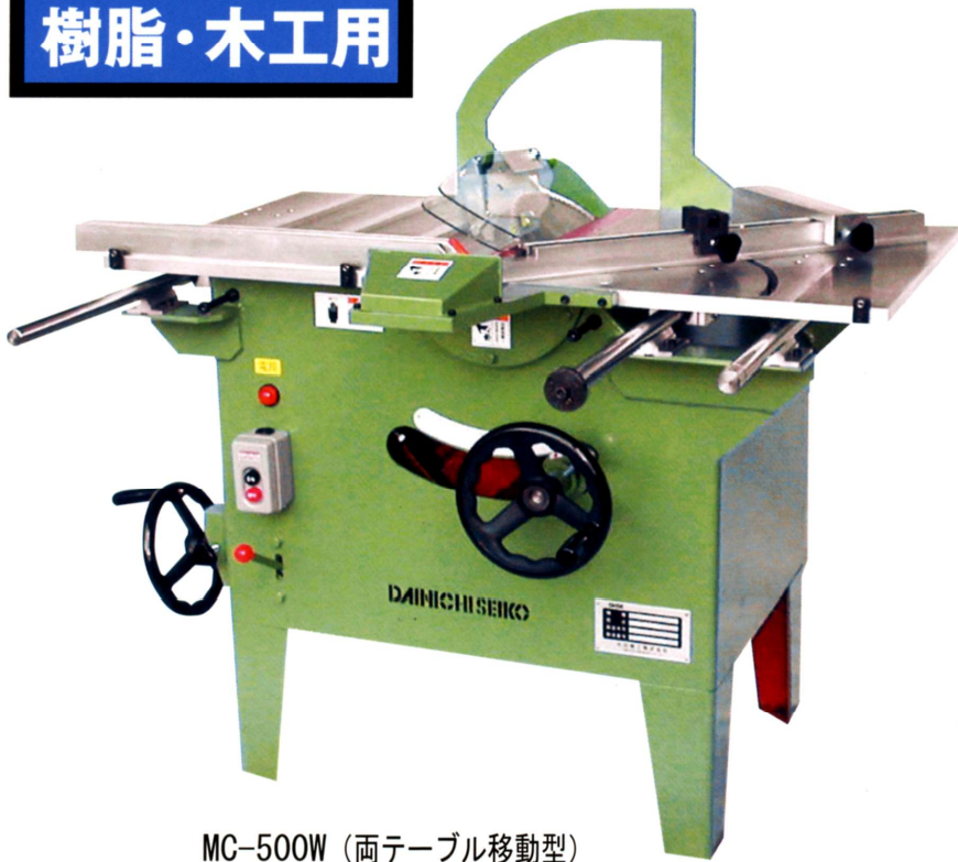
MC-500W (両テーブル移動型)