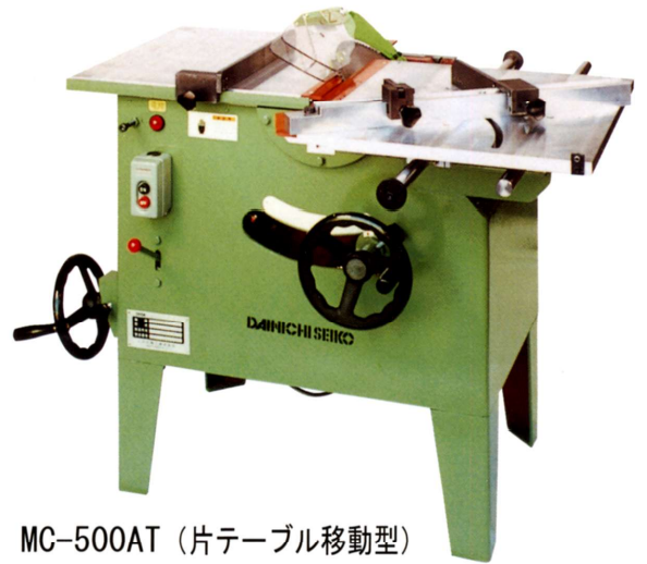
MC-500AT (片テーブル移動型)